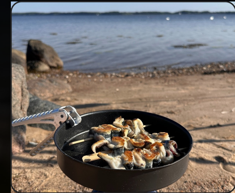
Beispiel: BottlePlus als natürlicher Teil von Catch & Cook